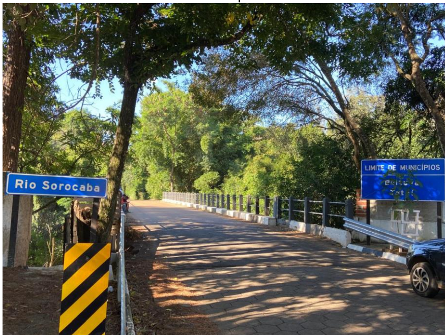
Figura 6 – Ponte que liga o município de Tatuí a Boituva. No lado direito vê-se uma placa delimitando os municípios

A ponte que liga Tatuí a Boituva foi meu ponto inicial — uma espécie de portal suspenso sobre o curso d'água que seguia, contínuo, para além do que eu podia acompanhar com os olhos. O concreto da estrutura gemia sob o peso constante e reverberava o tráfego. Cada passagem de veículo produzia um ronco surdo e profundo, quase subterrâneo, resultado da fricção áspera dos pneus que se misturava ao sopro das margens. Ali, o rio parecia expandir o próprio corpo, como um animal despertando.