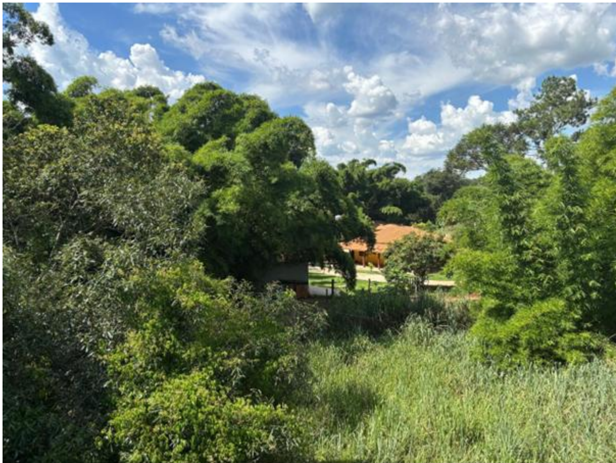
Figura 4 – Na margem direita do rio Sorocaba, havia um conjunto de casas — provavelmente usadas como residências de veraneio. Lembro-me de enxergar apenas os topos dos telhados, despontando entre as árvores. Três décadas se passaram desde então. Seriam aquelas as mesmas casas que, de alguma forma, me marcaram profundamente e permanecem vivas em minha memória até hoje?