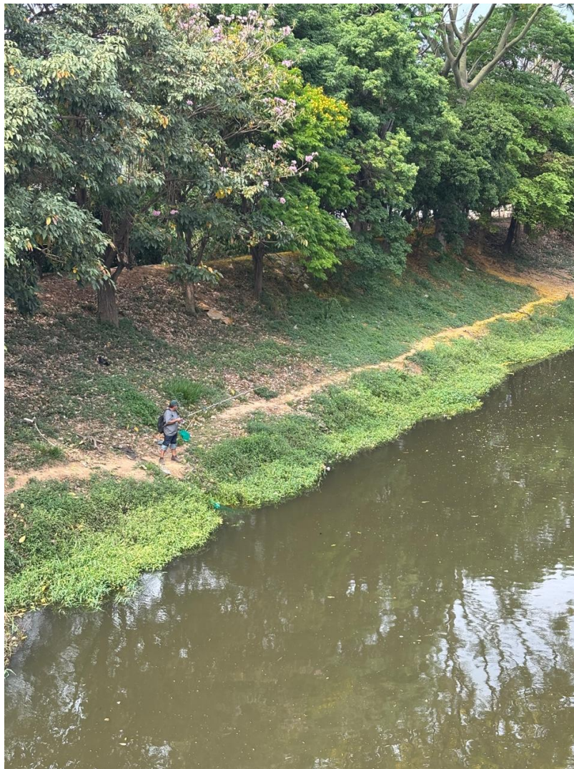
Figura 14 – Um pescador urbano na margem direita do rio Sorocaba

pescar em pleno centro urbano, entre a pressa das motos e dos carros, o barulho dos ônibus e o peso concreto das pontes.