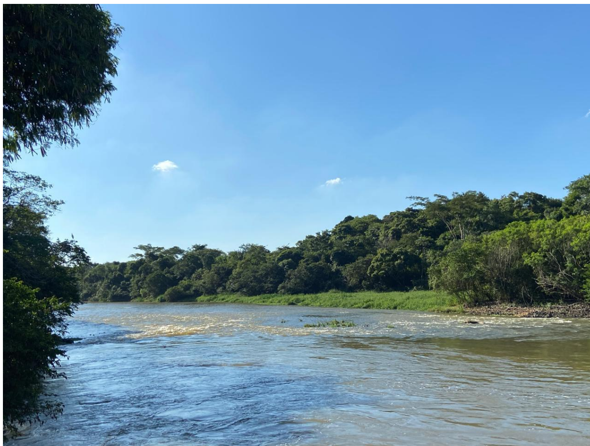
Figura 9 – Após a barragem, as águas do rio descem agitadas – pode-se ouvir o som apontando a sua câmera para a figura 10 - prosseguindo em direção à sua foz com o Rio Tietê. Essa confluência ocorre a uma distância aproximada, em linha reta, de 38,5 quilômetros