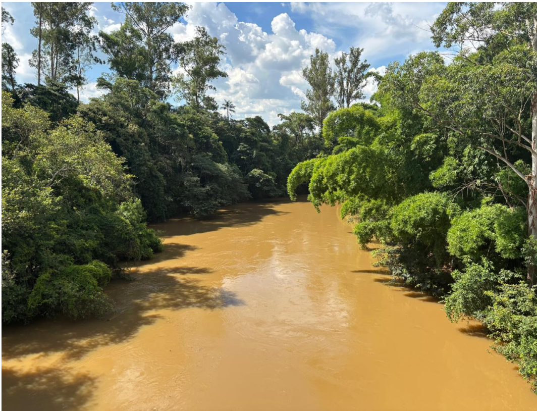
Figura 2 - Trecho do rio Sorocaba que passa debaixo da ponte indo em direção à Laranjal Paulista em que desembocará no rio Tietê. Desse ponto até a foz, em linha reta, dista aproximadamente 33,8 km. Na margem direita da foto encontra-se algumas residências que fazem parte do bairro “Terras de São Francisco”, considerado parte da zona rural de Boituva

Aquela imagem ficou gravada na minha memória 7 . Uma série de perguntas surgiu ao olhar aquela paisagem... Como aquilo aconteceu? Por que as pessoas moravam às margens de um rio sabendo do risco de alagamento? De onde vinha o rio Sorocaba? E até onde ele se estendia?