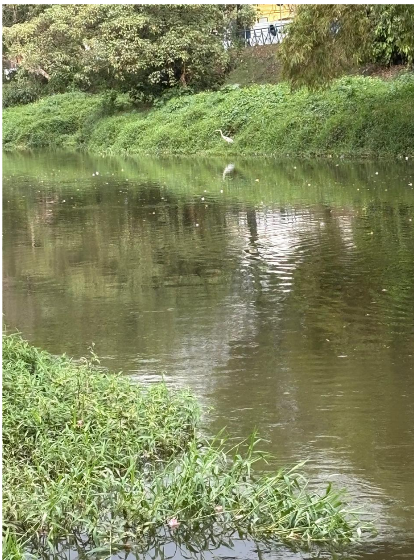
Figura 13 – No início da trilha, numa das margens do rio Sorocaba, encontro uma garça imóvel, esguia, quase uma vírgula branca inscrita no espaço

caminhar, escutar e sentir seus territórios? Ali, entre a garça imóvel e o barro úmido que grudava no meu tênis, percebi que o rio oferecia mais do que paisagem — oferecia possibilidades pedagógicas. Suas margens, seus cheiros, suas contradições e resistências sugeriam outras formas de ensinar e aprender Geografia, formas em que o território não fosse apenas conceito, mas encontro; não apenas conteúdo, mas relação viva com a cidade, com as águas e com as tensões socioambientais que atravessam o cotidiano escolar.