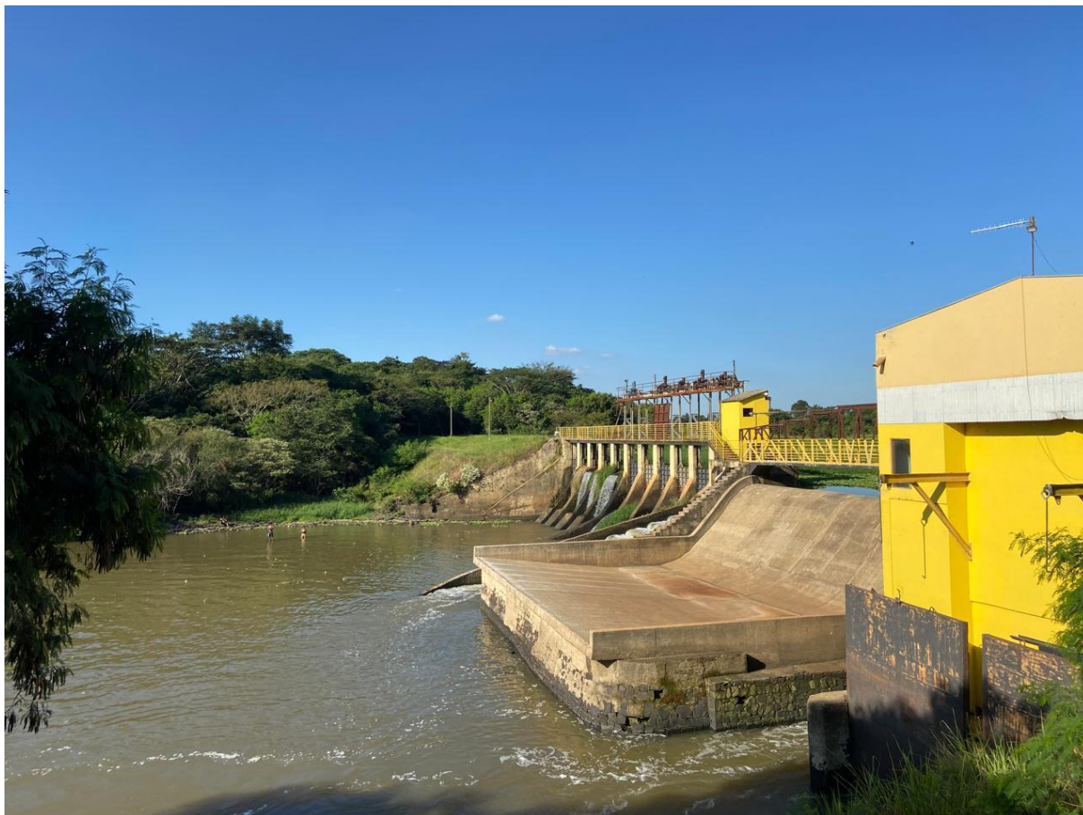
Figura 8 – Usina Santa Adélia pertencida à Fábrica de Tecidos Santa Adélia, da Campos & Irmãos. Ela retornou as operações em 2014, quando passou a realizar de ações monitoramento da qualidade da água e controle da vazão do rio Sorocaba