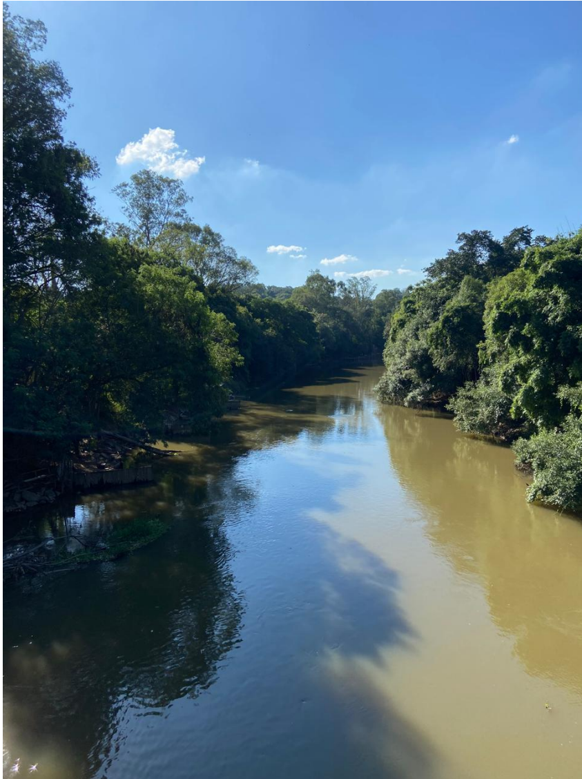
Figura 7 – Desse o rio Sorocaba a pouco mais de 300 metros recebe as águas do rio Tatuí