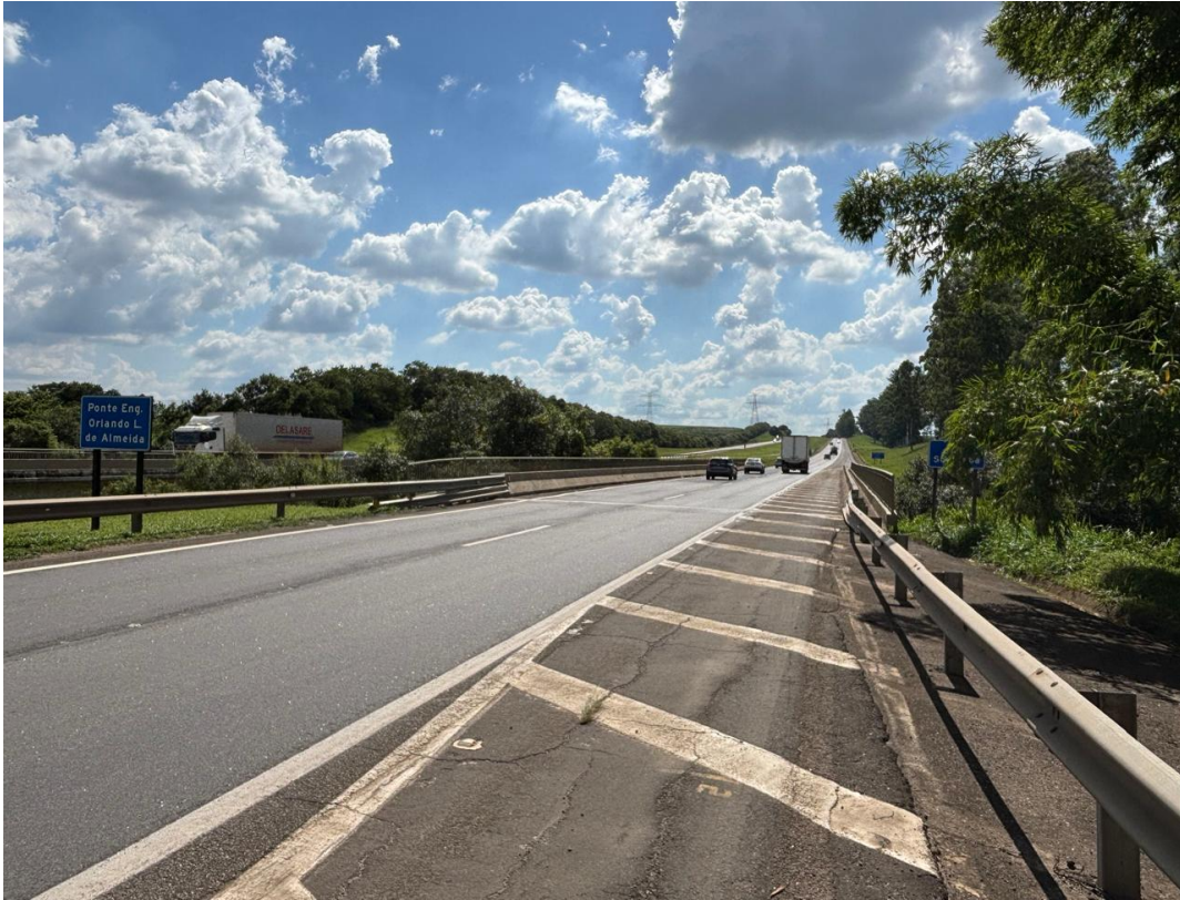
Figura 1 - A esquerda da figura encontra-se a placa com o nome da ponte e a direita, nesse ângulo, encoberta pelo galho da árvore há uma placa com a indicação que ali passa o rio Sorocaba