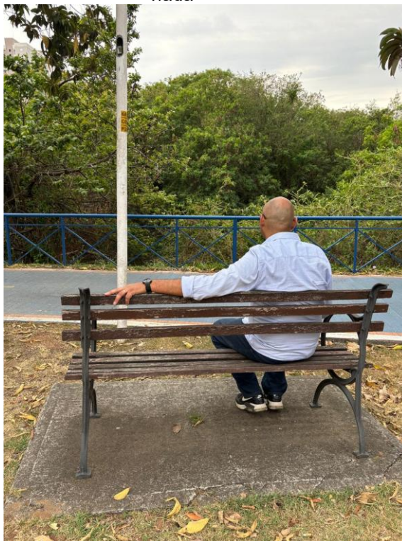
Figura 15 – A grade, no fim das contas, era barreira só para mim — para o rio, não significava nada