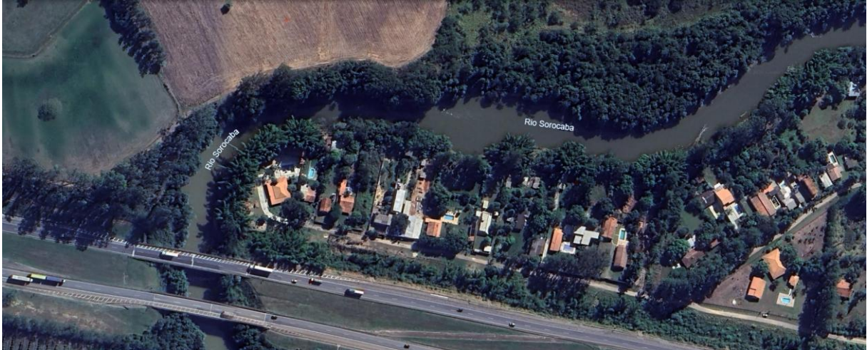
Figura 3 - A imagem de satélite mostra a grande quantidade de casas localizadas à beira do rio Sorocaba e que, comumente no verão, sofrem com o alagamento por conta do transbordamento do rio.