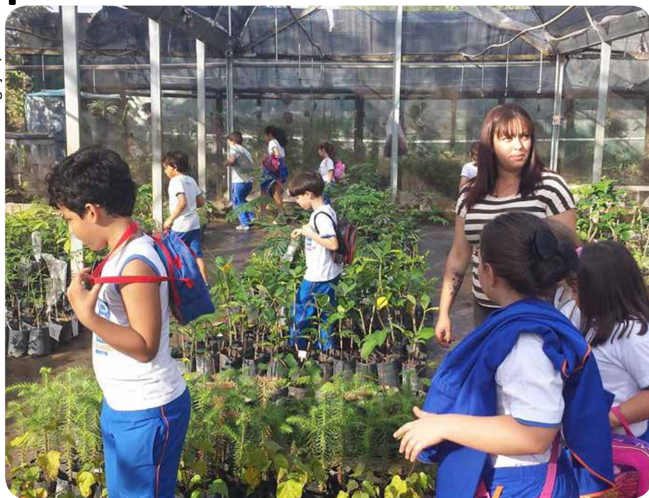
Em maio, grupo de estudantes visitou o Núcleo de Estudos Ambientais da Uniso

Um grupo de cerca de cem crianças do Colégio Dom Aguirre, junto a seus professores e familiares, fará o plantio de mudas de árvores na Cidade Universitária, no dia 14 de novembro.