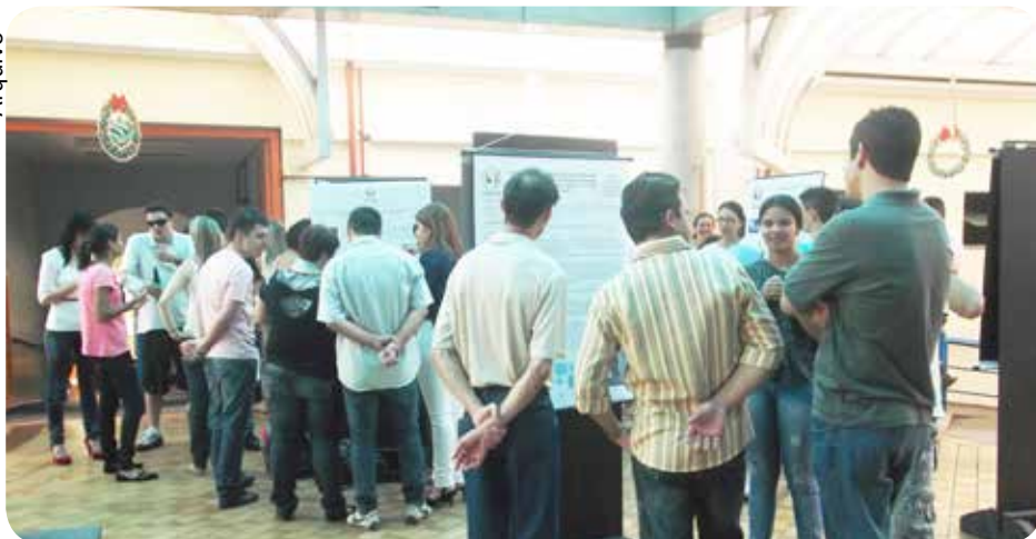
Trabalhos estarão em exposição no câmpus Trujillo, como na edição passada

O evento, que encerra as atividades dos cursos Tecnológicos, das áreas de Gestão e Negócios, acontecerá das 14h às 17h, no câmpus Trujillo, com entrada aberta ao público.