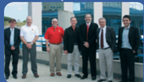
Os visitantes com a Reitoria

Os visitantes conheceram a Cidade Universitária e discutiram novas possibilidades de intercâmbio acadêmico com a Reitoria e professores.